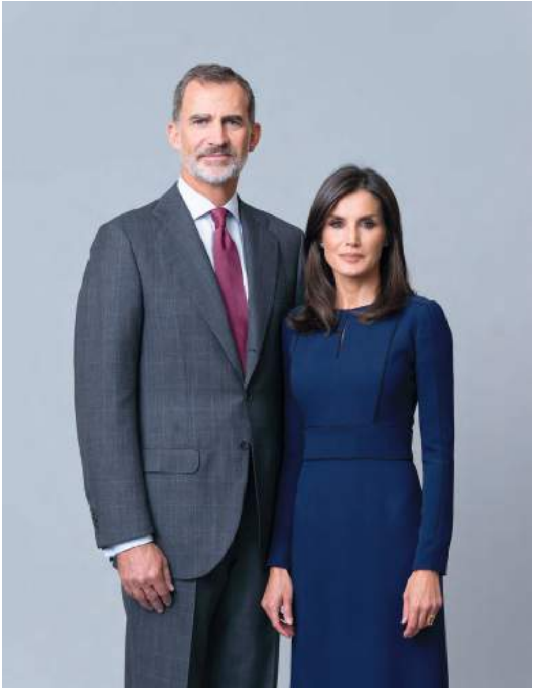
SS. MMM Reyes de España